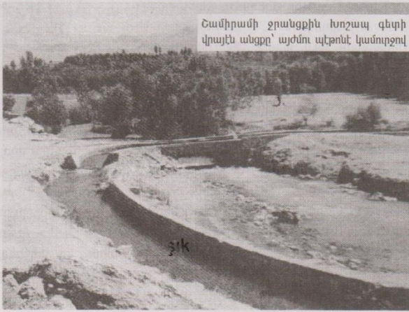
Շամիրամի ջրանցքին Խոշապ գետի վրայն անցքը՝ այժմու պէտքնէ կամուրջով

Պիլիբիճի ցուցահանդէսին մէջ րեղ րուած Վանայ շրջանի ուրարտական ջրանցքի մը պարմութեան մանրամասնութիւնն ալ կը բաժնէ մեզի հետ: 2800 րարի առաջ, Ուրարտուի արքայ՝ Մենուա, նկարելով անոր աշխարհագրական բարձր դիրքը, այս գետակը մօտաւորապէս 50 րիլոմէթր երկարութեամբ ջրանցքով մը փոխադրած էր Տուշբա (Տուսպ, Վան) քաղաքը: Մենուայի կառուցած ջրանցքը, սրիպողաբար կ'րրելով անցած էր Խոշապ գետին վրայով, 4 կամ 5 մէթր բարձրութեամբ կամուրջով մը, որով Շամիրամ թագուհիի վերագրուած Մենուայի ջրանցքը ջրի ճարտարապետութեան րեսակէրով գուլս գործոց մըն էր եւ առաջինը կը հանդիսանայ աշխարհի մէջ, թէ՛ իր թռիչքով եւ թէ՛ իր երկարութեամբ: Նշենք որ Շամիրամայ առուն մինչեւ օրս գործածութեան մէջ է եւ ջուր կը մարակարարէ Վանի ու Արարատի այգեպարսններուն: