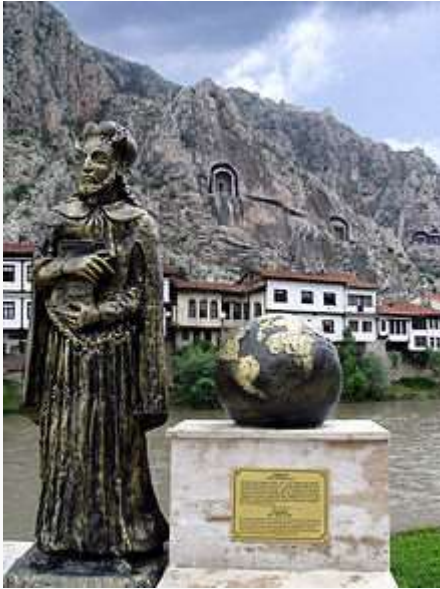
Amasya/Türkiye'de Yeşilirmak'ın kenarında bulunan Strabon Heykeli

Amasya'da doğdu ve Amasya'da öldü. Klasik Yunan eğitimi gördü. Aristodemos'tan hitabet dersleri aldı. MÖ 44'te öğrenimini sürdürmek amacıyla Roma'ya gitti. Başlangıçta Aristotelesçi görüşleri savunduysa da, sonraları Augustus'un öğretmenlerinden olan Athenodoros'un etkisinde kalarak Stoa okulunun görüşlerini benimsedi. MÖ 31'e değin Roma'da kaldı. MÖ 29'da Yunanistan'ı gezdi. MÖ 28'de Mısır'a gitti.