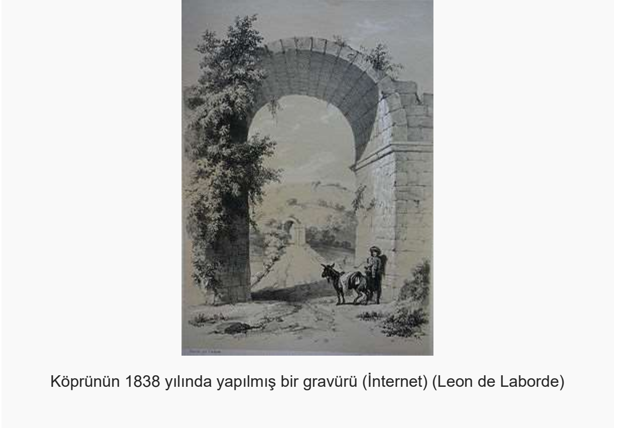
Köprünün 1838 yılında yapılmış bir gravürü (İnternet) (Leon de Laborde)

Justinianos Köprüsü (diğer adı Sakarya Köprüsü , halk arasında: Beşköprü ), Türkiye 'de, Geç Roma Döneminden kalma, yapıldığında Sakarya nehri üzerinde bir taş köprüdür. Yapı Doğu Roma İmparatoru Justinianos (527–565) tarafından başkent Konstaninopolis ile imparatorluğun doğu vilayetleri arasındaki ulaşımı kolaylaştırmak için inşa ettirildi. Neredeyse 430 m uzunluğundaki köprü, dev ölçüleri nedeniyle çağdaş yazar ve şairlerin eserlerine konu olmuştu. Justinianos'un Boğaziçi yerine