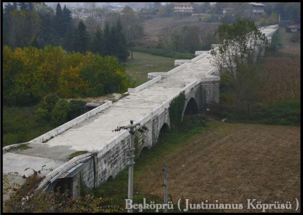
Beşköprü ( Justinianus Köprüsü )